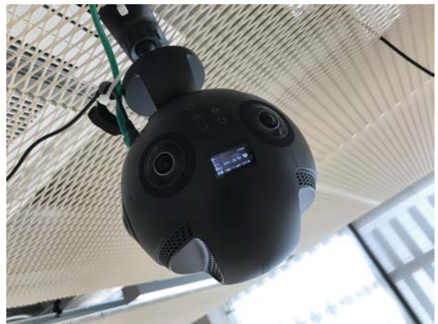
Kuva 2. Videonauhoituksissa käytetty 360-asteen kamera.

Korkealaatuisen kuvan ja äänen nauhoittaminen isossa ja kiireisessä tilanteessa on haasteellista. Videoaineistojen nauhoittamisessa käytettiin yhtä 360-asteen videokameraa (kuva 2), joka kiinnitettiin keskelle operaatiokeskuksen kattoa, ja yhtä kameraa, jolla nauhoitettiin yleiskuva huoneesta. Kamerat yhdistettiin tietokoneeseen LAN-kaapelilla ja nauhoituksista tehtiin koko ajan varmuuskopioita. Osallistujien puhe nauhoitettiin kymmenellä korkealaatuisella