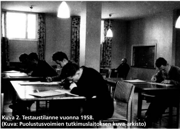
Kuva 2. Testaustilanne vuonna 1958.