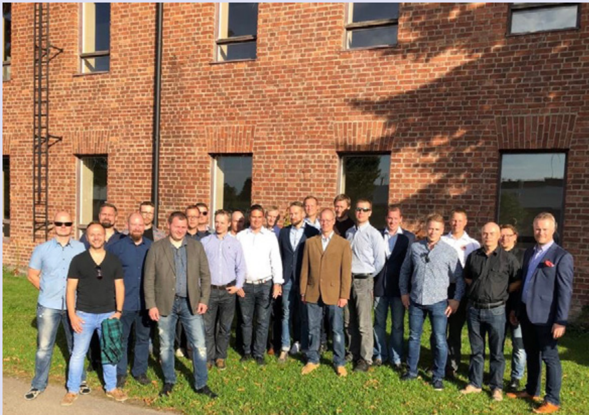
RUK214 PIONK kesällä 2019.

Reserviupseerikurssin 214 Pioneerikomppanian 20-vuotisjuhlatapaaminen järjestettiin Reserviupseerikoulussa Haminassa 31.8.-1.9.2019. Kurssitapaaminen oli ensimmäinen laatuaan ja suurin osa kurssiveljistä näki toisensa ensimmäisen kerran sitten RUK:n päättymisen.