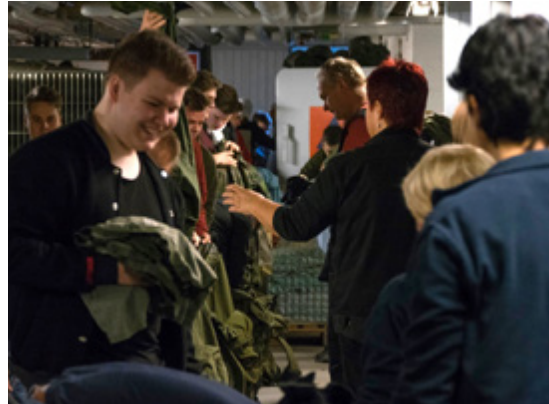
Saapumiserän 1/19 kotiutuvat varusmiehet palauttivat varusteitaan hymyssä suin.

TEKSTI: tiedotussihteeri Marika Heinilä