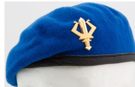
Sotilassoittajan baretti ja lakkimerkki