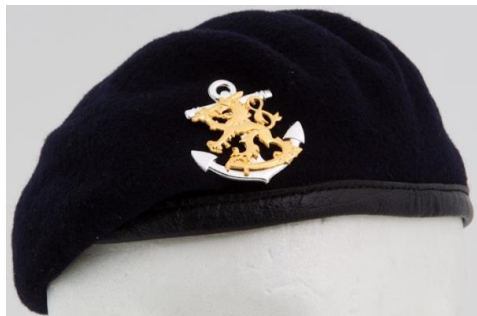
Merivoimien baretti ja lakkimerkki