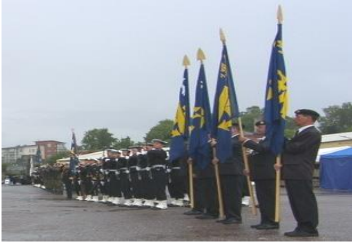
Merivoimien laivastojoukoista muodostettu kunniaosasto (taustalla)