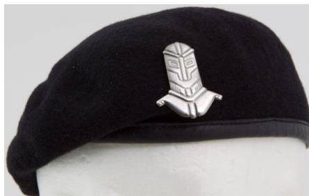
Panssarijoukkojen baretti ja lakkimerkki