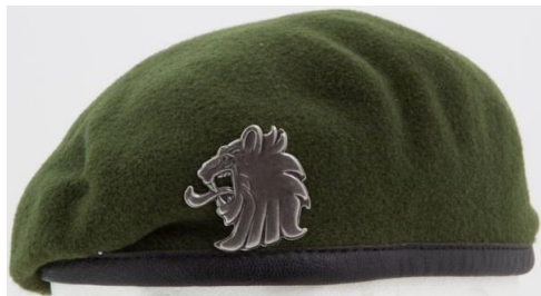
Maavoimien baretti ja lakkimerkki