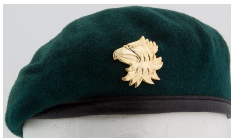
Rannikkojääkärien baretti ja lakkimerkki