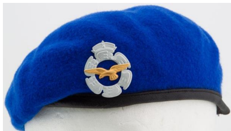
Ilmavoimien baretti ja lakkimerkki