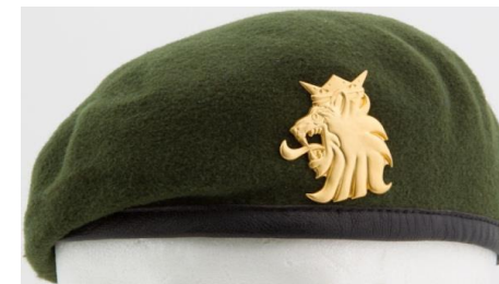
Maavoimien baretti ja Suomen kansainvälisten joukkojen lakkimerkki