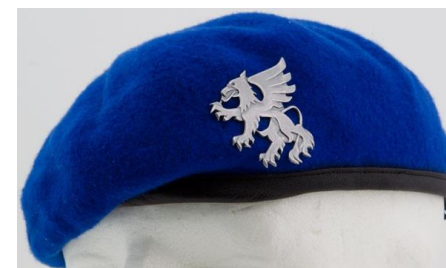
Ilmavoimien baretti ja helikopterijoukkojen lakkimerkki