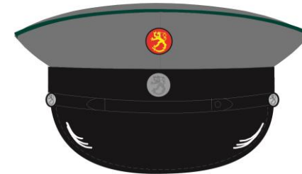
Yllä piirroksia Kaartin jääkäriyrykmentin kunniakomppanian edustuspuvun m/10 pukineista