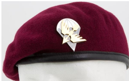
Laskuvarjojääkärien ja erikoisjääkärien baretti ja lakkimerkki