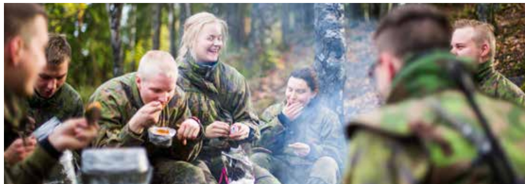
Veltri / Nevalainen

Flygvapnet ger handräckning till andra myndigheter och stöder tryggandet av samhällets vitala funktioner samt svarar för att delta i krishanteringsuppgifter som beordrats flygvapnet.